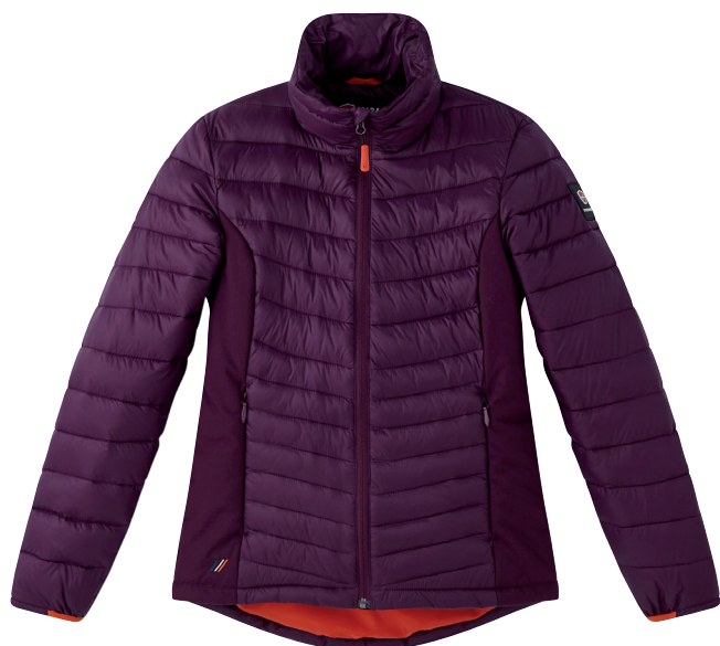
■ 1783 PURPLE