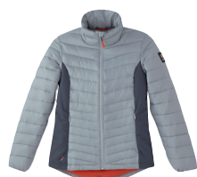
■ 1713 GREY